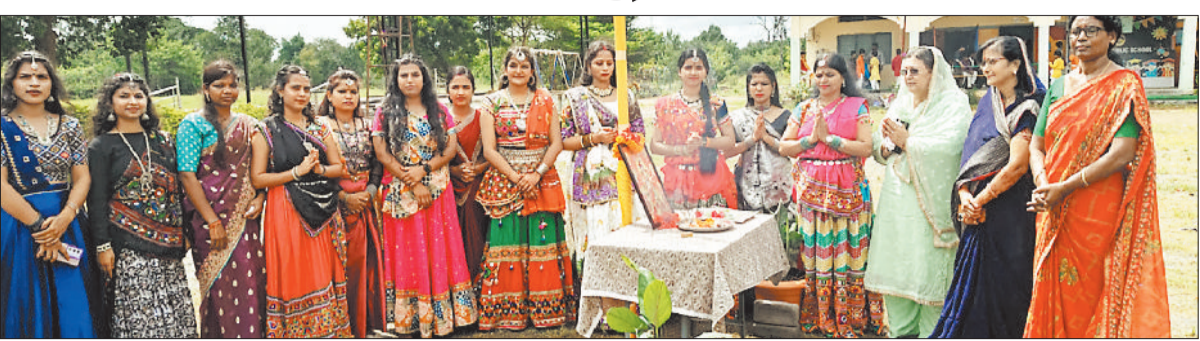
पथलगांव