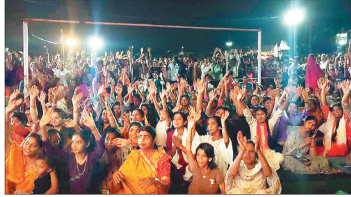
भक्ति गीत में झूमते श्रद्धालु।