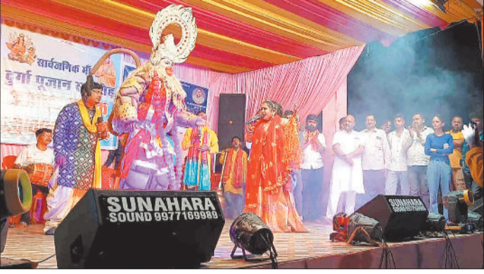
जागरण की प्रस्तुति देते कलाकार।